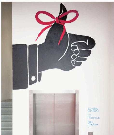
Beste illustratie: Piet Parra's campagne voor Nike